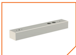
a26150 Крышка BS-KR-3 White