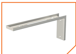
a4086 Кронштейн BS-K-3 White