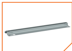
a5062 Штанга BS-SH-4-300 Gray