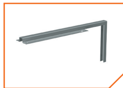
a5060 Кронштейн BS-K-4 Gray