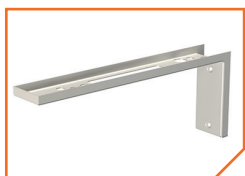
a4086 Кронштейн BS-K-3 White